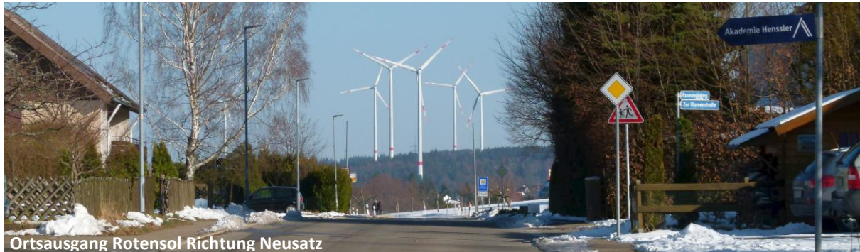
Ortsausgang Rotensol Richtung Neusatz